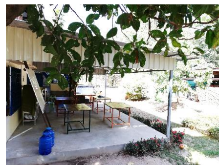
Avant - Maintenant