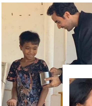
Magicien de France et Lydol