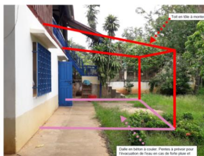
Foyer garçons RDC façade Nord

Quand des élèves arrivent en retard en cours ou dorment pendant les cours complémentaires